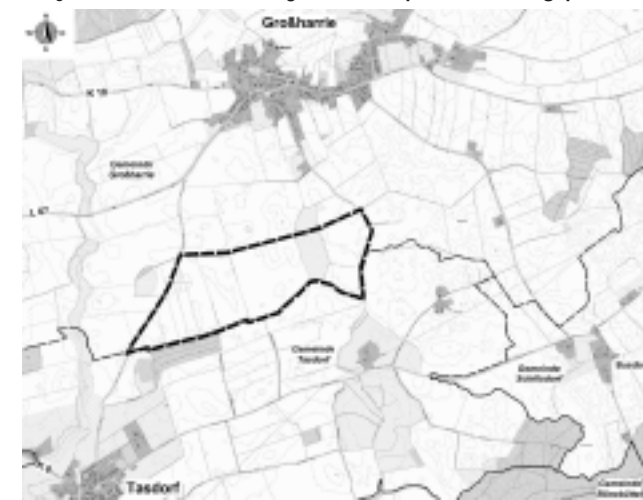
Wankendorf, den 01.06.2023 Az. 622-21-6/14 Amt Bokhorst-Wankendorf, Der Amtsvorsteher

Diese Auslegung gilt gleichzeitig als Beteiligung von Kindern und Jugendlichen nach § 47 f der Gemeindeordnung. Übersichtsplan: Bebauungsplan Nr. 14